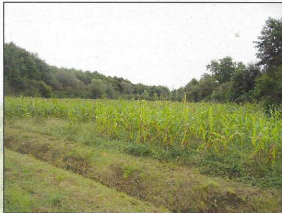
Culture de maïs