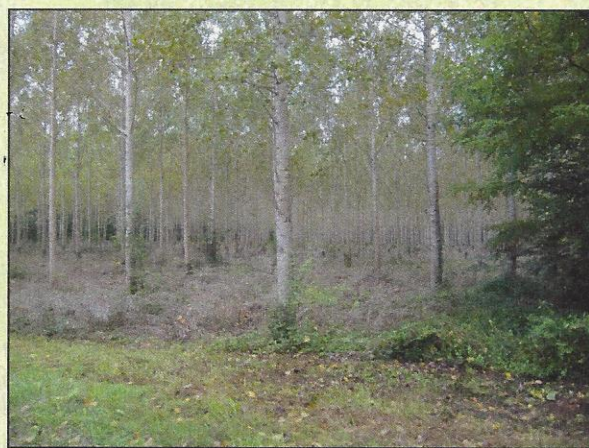
Plantation de peupliers