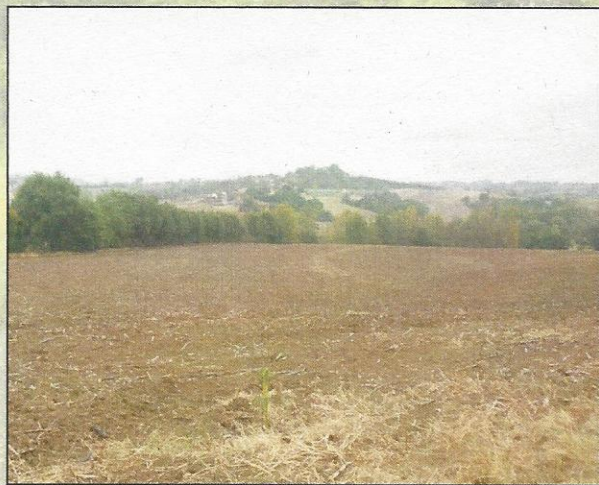
Retournement de prairies